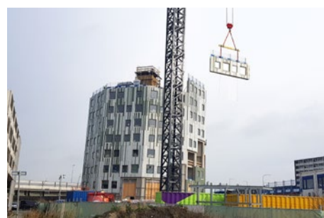
De Helix op dit moment

Vanaf de noordelijke ringweg wordt het nieuwe woongebouw De Helix aan de kop van de Bedumerweg goed zichtbaar. Vorige week is de vloer van de achtste verdieping gestort. Het gebouw is nu 24 meter hoog. Het complex groeit met een tempo van 1 verdieping per 9 werkdagen.