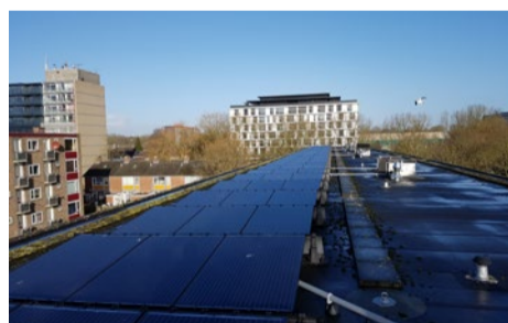
Zonnepanelen op een portiekflat in Selwerd

voort. Dit wordt verrekend met een huurverhoging die ongeveer vijftig procent van de opbrengst is.